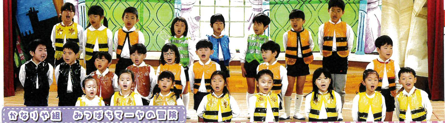
ふゆりや組 ぴゅぷるーやの冒険