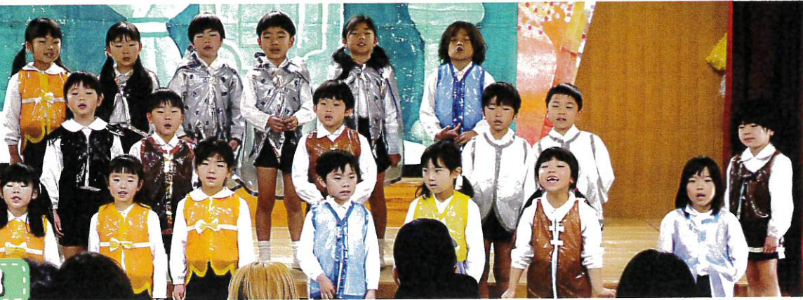
うぐいす組 雪の女王